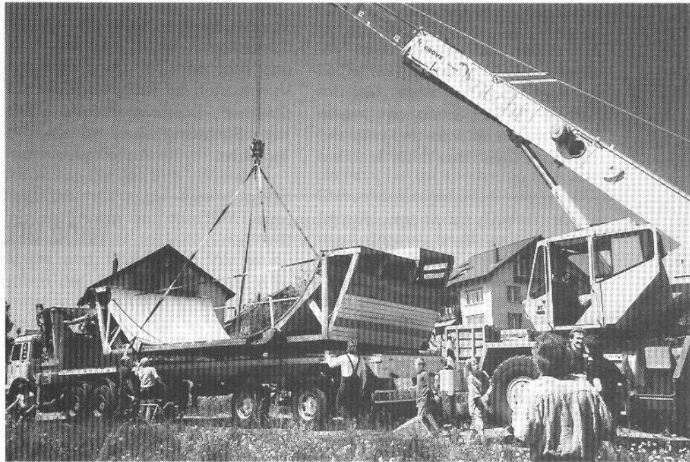
Spezialtransport in Aktion