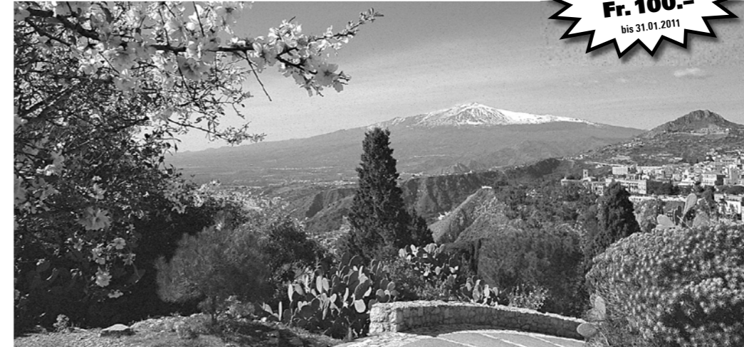
Einmaliger Blick von Taormina zum Ätna