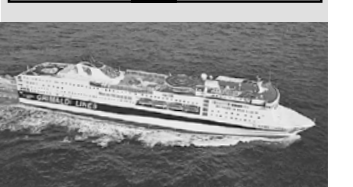
Fährpassage mit Grandi Navi Veloci

Jetzt buchen: 056 484 84 84 oder www.twerenbold.ch