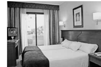
Schöne, komfortable Zimmer

Wir wohnen fünf Nächte im modernen, guten Mittelklasshotel Alixares T-*** (off. Kat. ****), das sich an Panoramalage oberhalb des Stadtzentrums und in unmittelbarer Nähe des Parkgeländes der Alhambra befindet. Die 200 Zimmer sind komfortabel eingerichtet und verfügen über Bad oder Dusche/WC, Haartrockner, Klimaanlage, Minibar, Mietsafe. Weitere Einrichtungen: Restaurant, Bar, Lounge, Freiluftschwimmbad (saisonal geöffnet).