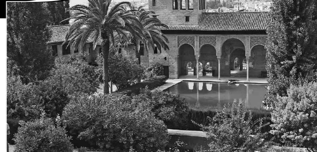
Alhambra und Generalife Gärten