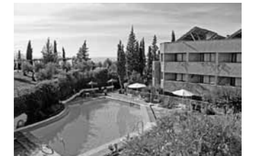
Panorama-Hotel Alixares in Granada