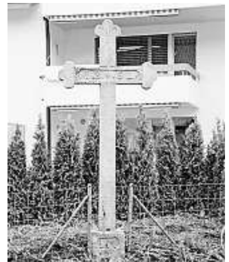
Das Wegkreuz in der heutigen Umgebung.