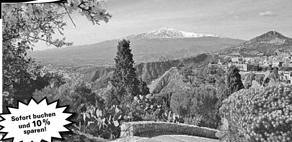
Einmaliger Blick von Taormina zum Ätna