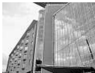
Hotel NH Prague, Prag