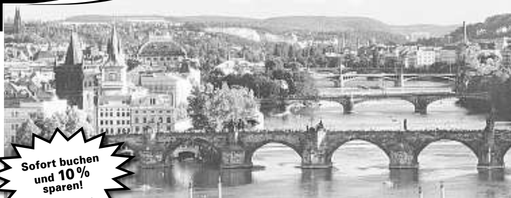
Zahlreiche Brücken überspannen die Moldau in Prag