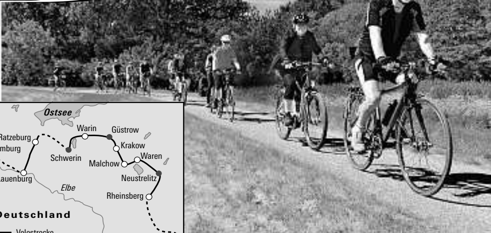
Velofahren in guter Gesellschaft