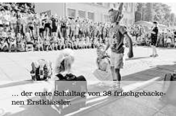
... der erste Schultag von 38 frischgebackenen Erstklässler.