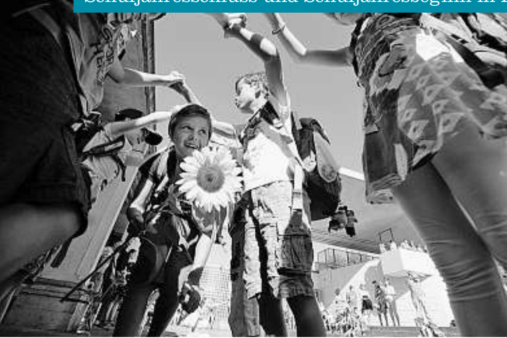
Unser neues Schulhaus Kommt! Spatenstich am 1. Schultag!