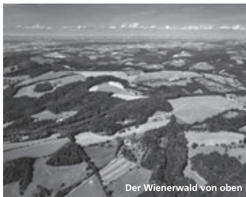
Der Wienerwald von oben