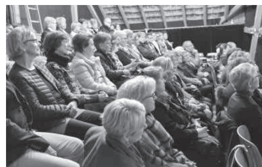
Gäste im RemiseTheater