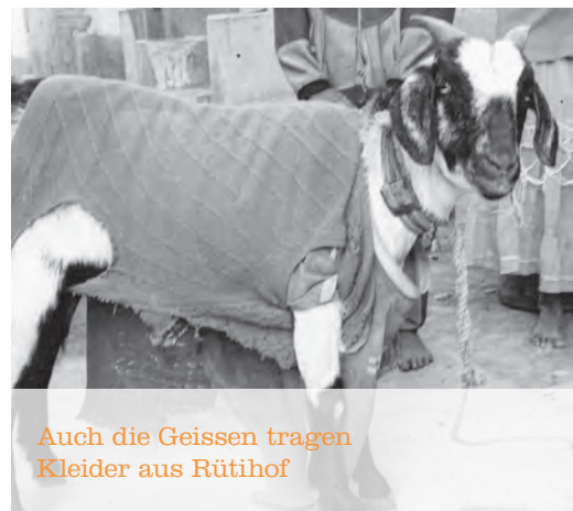
Auch die Geissen tragen Kleider aus Rütihof

Flüchtlingskonvention). Auf längere Zeit ist dies für Privatpersonen nicht zumutbar. Diese können andere wertvolle Hilfsleistungen für Flüchtlinge und ihre Integration übernehmen.