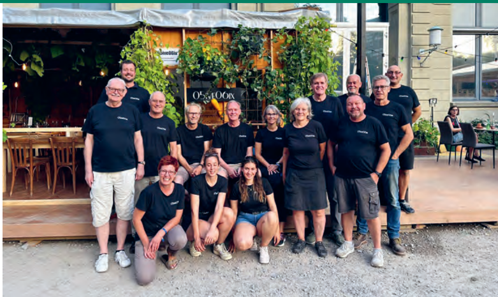
Herzlichen Dank an alle die mitgeholfen haben, allen voran dem OK-Team und allen Helferinnen und Helfern!