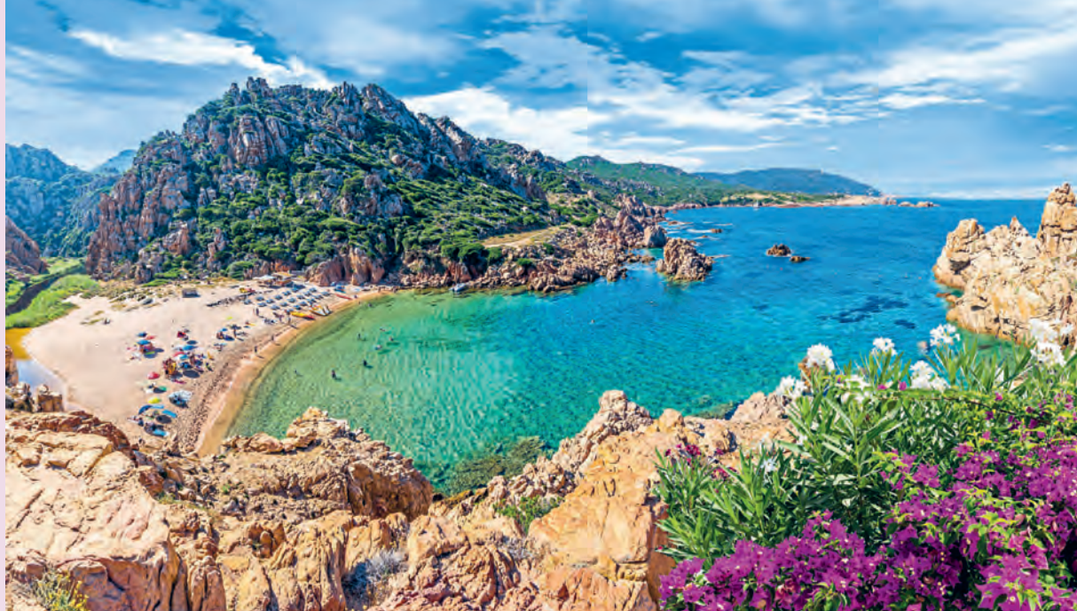
Traumhafter Strand auf Sardinien