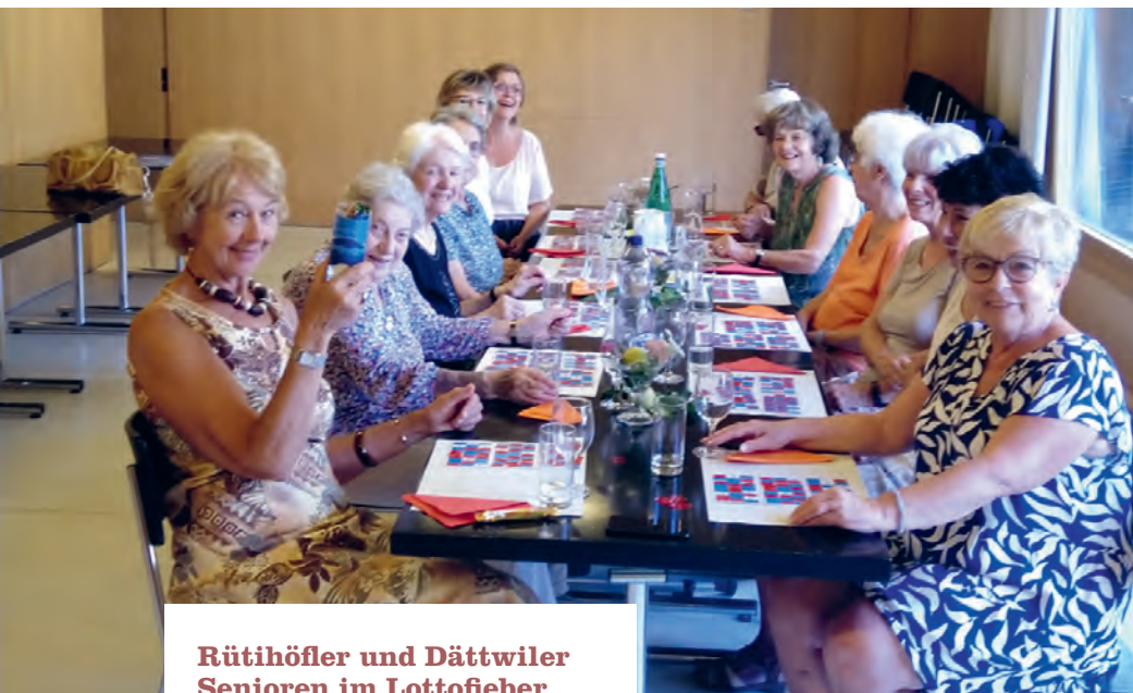
Rütihöfler und Dättwiler Senioren im Lottofieber