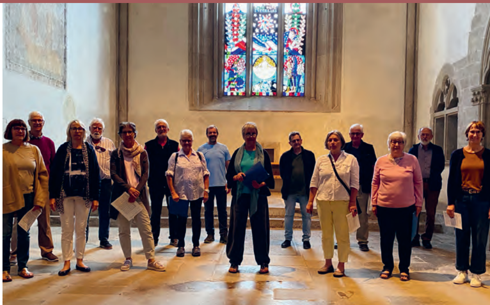
Gesang in der Klosterkirche Kappel