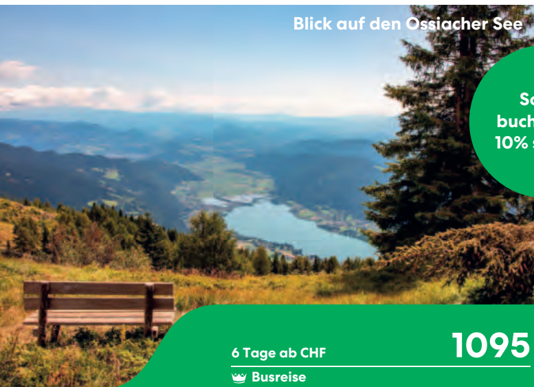
Blick auf den Ossiacher See