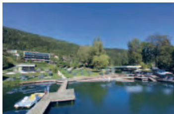
Seehotel Hoffmann (off. Kat. ****)

Fünf Nächte im guten Mittelklasshotel direkt am Ossiachersee.