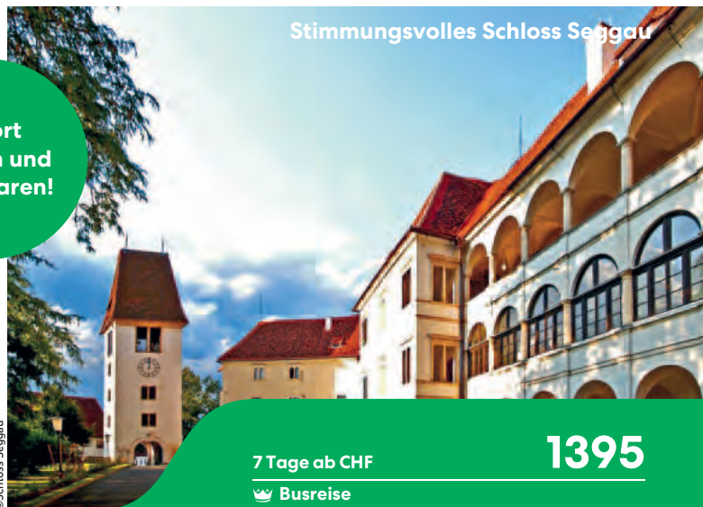
Stimmungsvolles Schloss Seggau